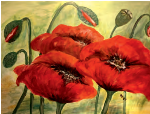
Regina Pensold „Mohnblumen“