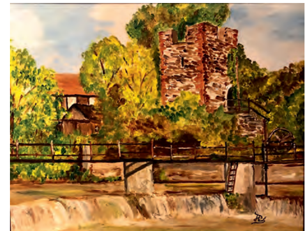
Jan Taut „Wehrturm der Weidaer Stadtmauer“