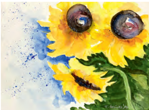
Regina Heinke „Sonnenblumen im Auge des Betrachters,“