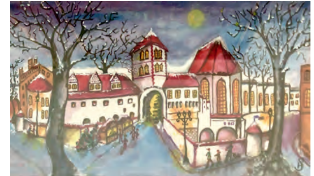
Heinz Schultz „Wintermärchen“

Do. bis So. 10 bis 18 Uhr, Ferien u. Feiertage Mo.-So. 10 bis 18 Uhr