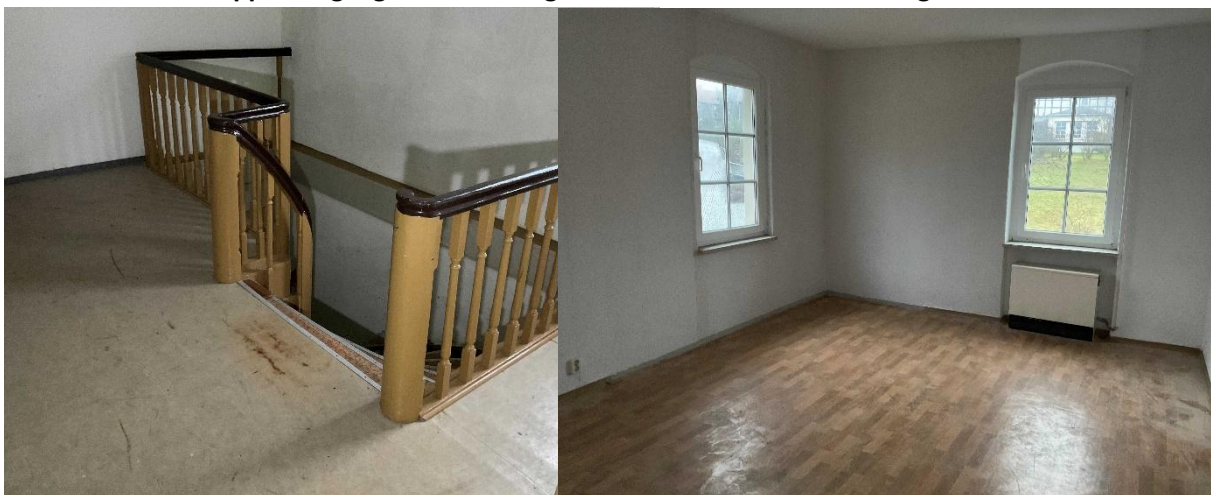
Treppenaufgang zum 1. Obergeschoss und Raum im 1. Obergeschoss