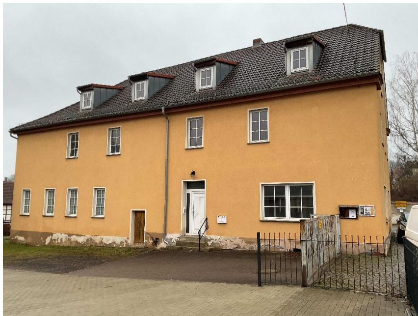
Steinsdorf 32 (Seitenansicht)