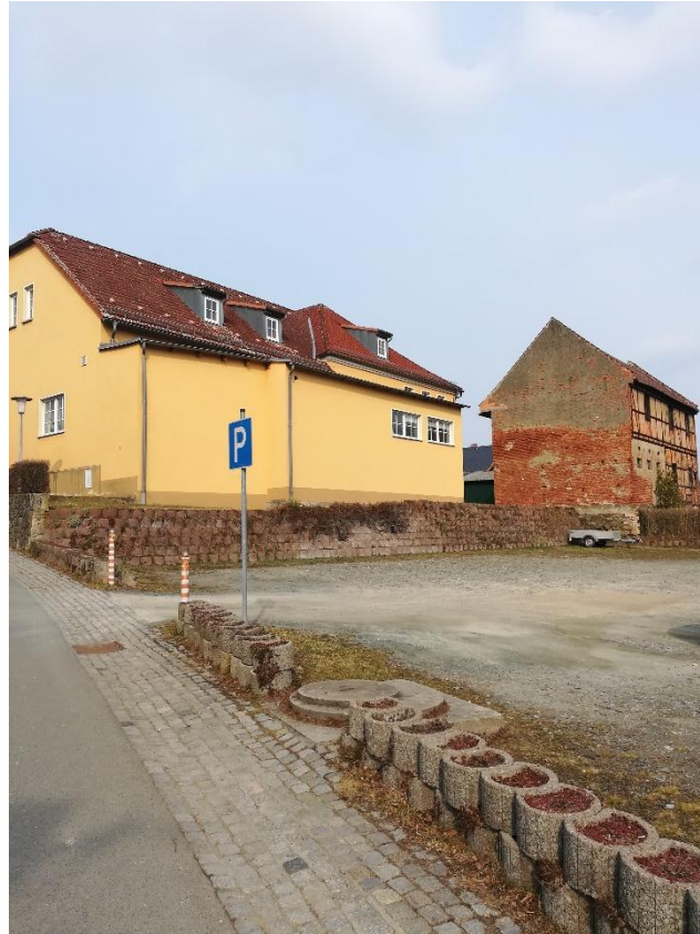
Steinsdorf 32 (Rückseite)